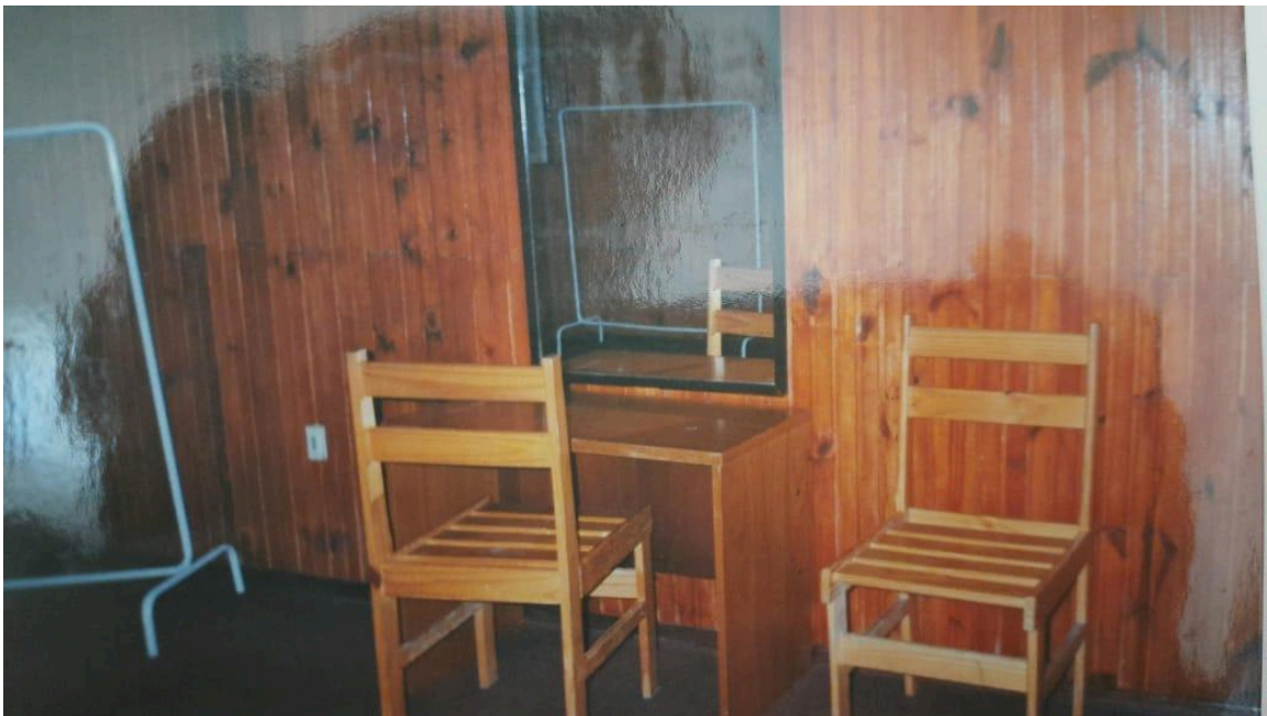
Figura 10 - Espelho do camarim do teatro em 1996