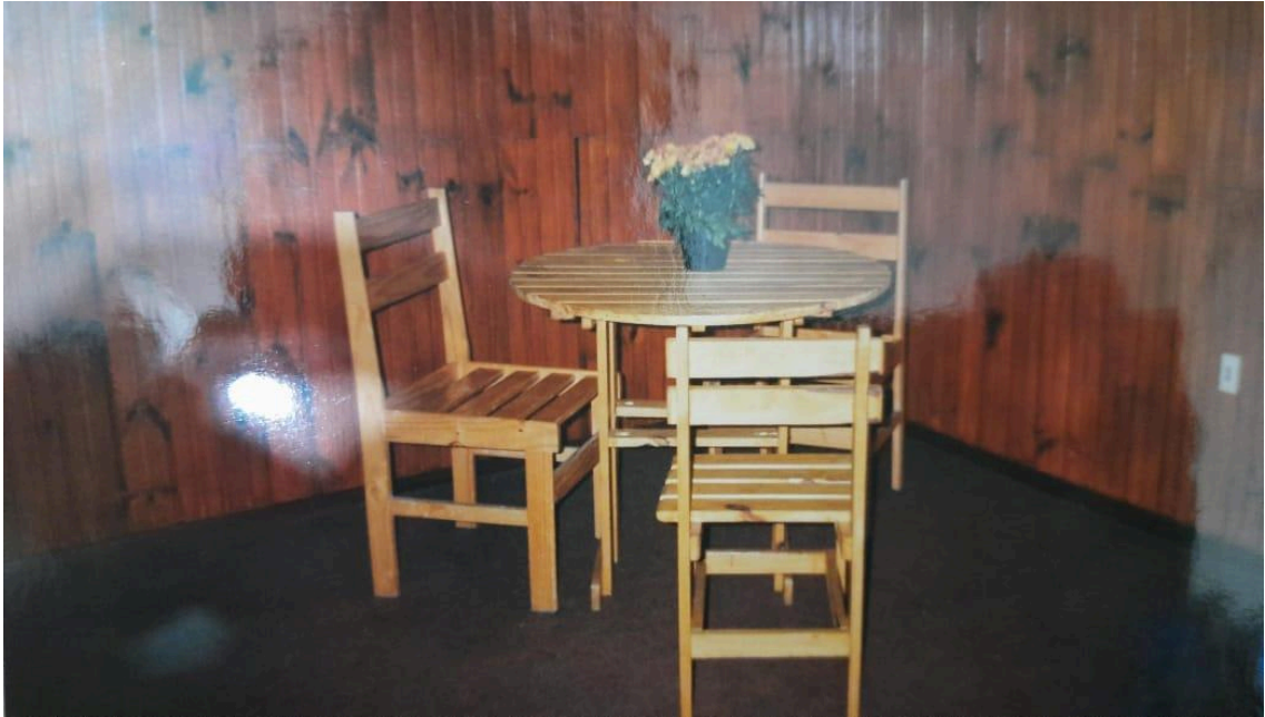
Figura 11 - Mesa do camarim do teatro em 1996