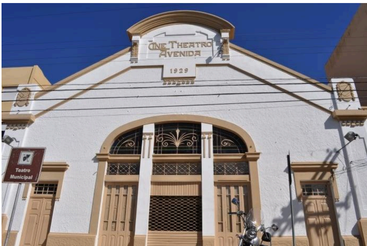
Figura 1 - Teatro Municipal de Rio Grande

O Teatro Municipal do Rio Grande (Figura 1) constitui um dos mais importantes espaços culturais da cidade, reunindo em sua trajetória elementos históricos, artísticos e simbólicos que refletem a identidade e a memória da comunidade rio-grandina. Conforme cita Bittencourt (2008 apud OLIVEIRA, 2020), pesquisar a respeito das manifestações teatrais atrela inerentemente as pesquisas a respeito da história social da arte e da arquitetura, sendo essas partes importantes da constituição da cidade e da identidade de seus habitantes. Além de um edifício de relevância arquitetônica, o teatro representa um patrimônio vivo, resultado de décadas de produções, encontros e manifestações artísticas que marcaram a história local.