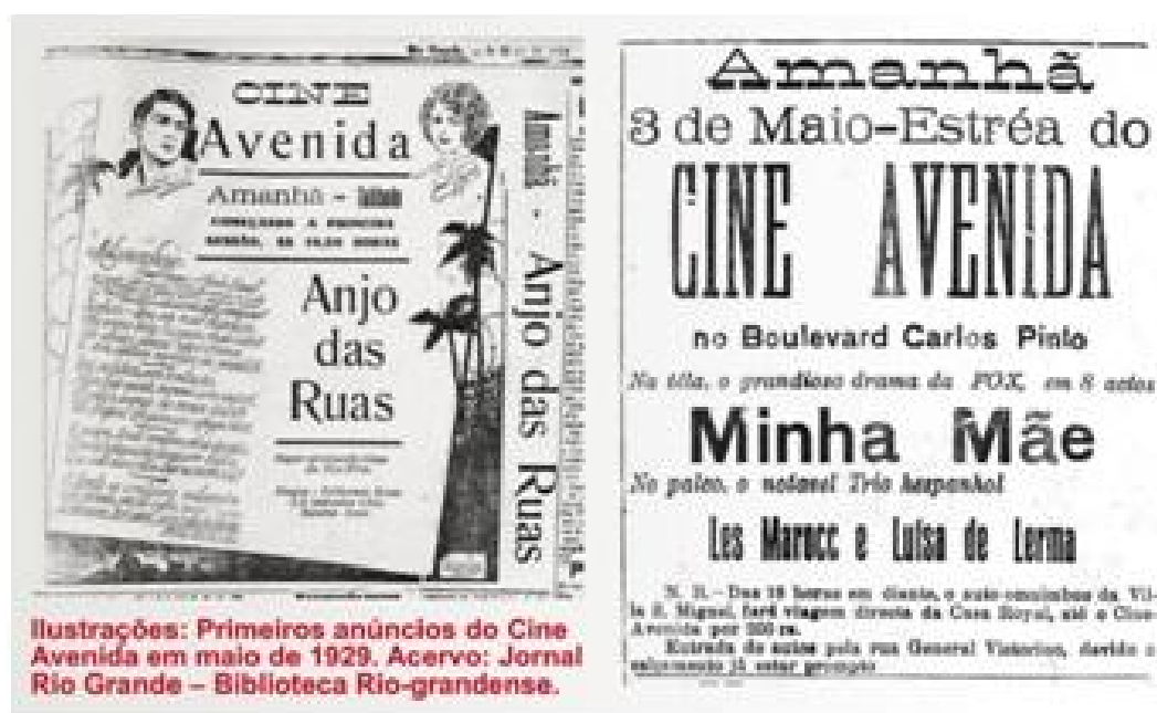
Figura 4 - Recorte de anúncio de inauguração do Cine Avenida em 1929