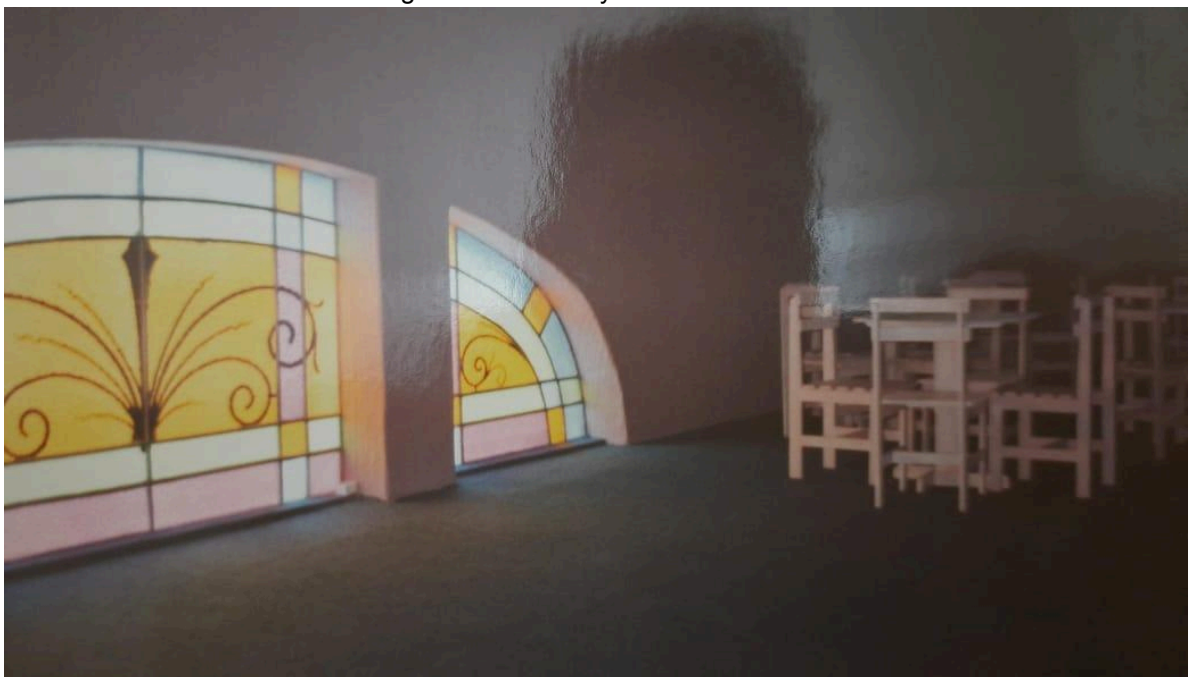
Figura 8 - Sala Polytheama em 1996