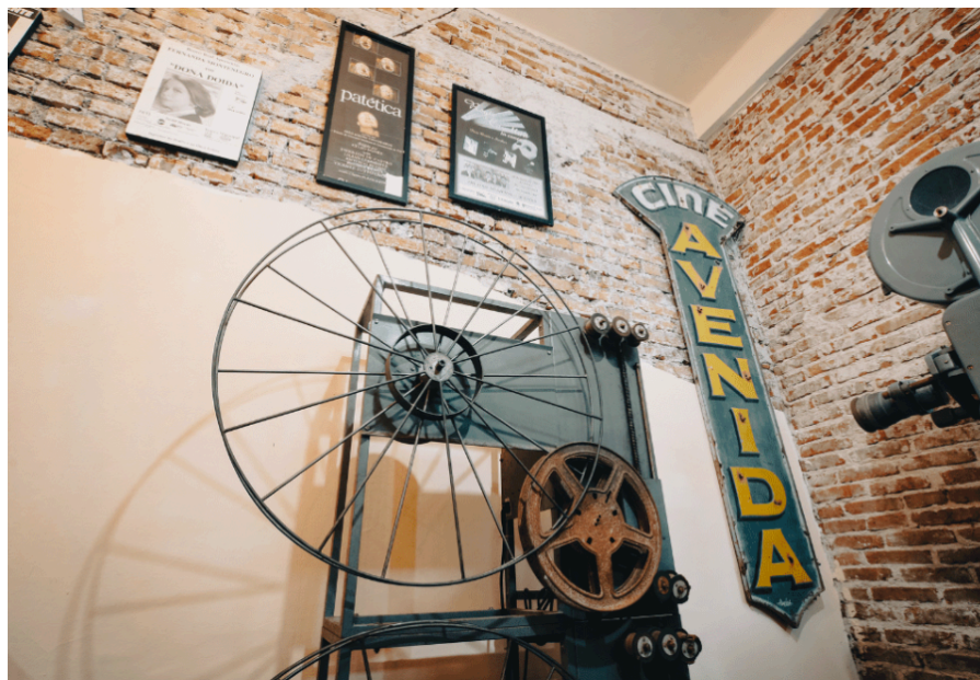
Figura 15 - Cartazes e fotos de antigos espetáculos no Cine Theatro