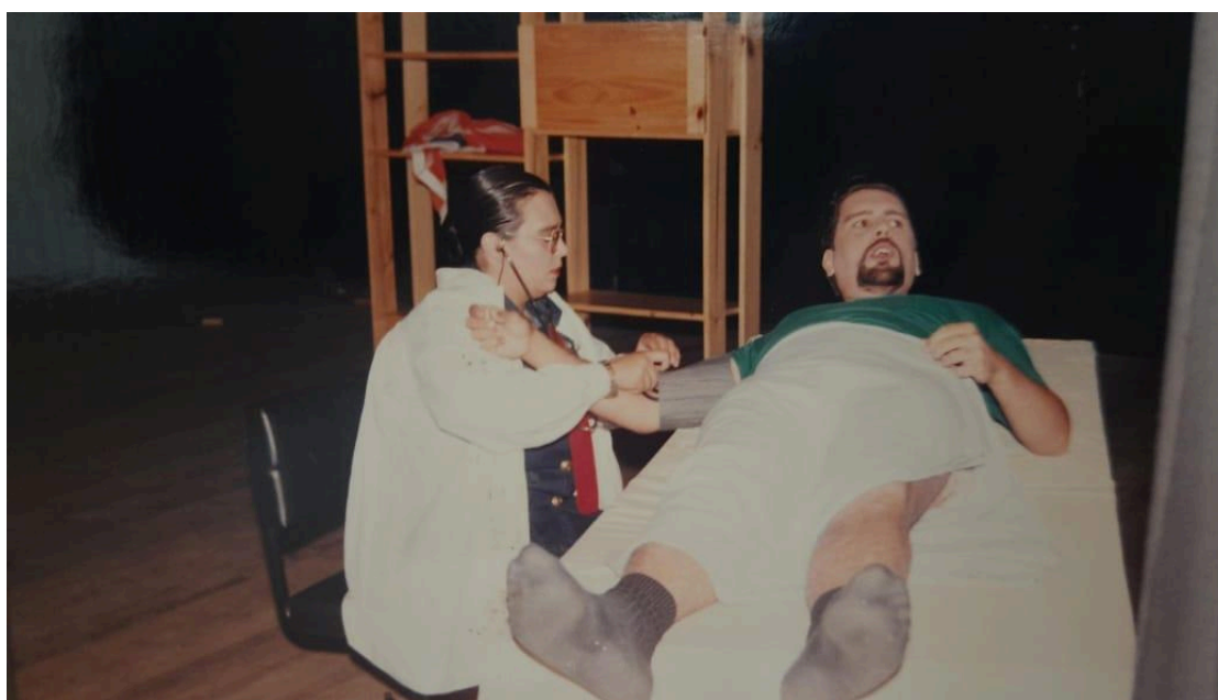
Figura 5 - Cena da peça O Próximo