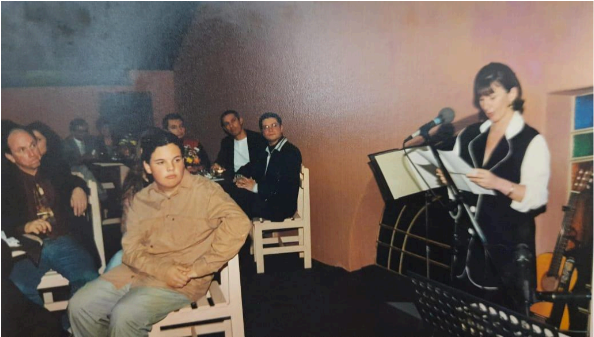
Figura 9 - Reunião de atores na sala Polytheama em 1996