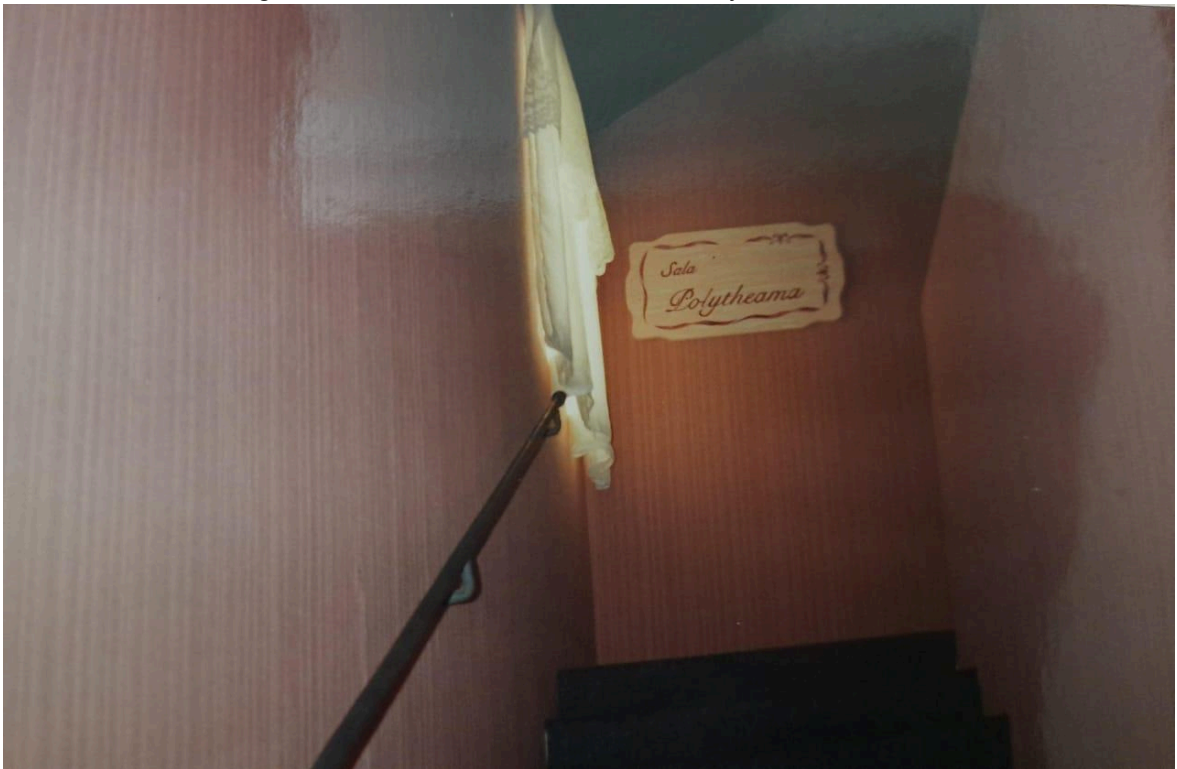
Figura 7 - Escadaria de acesso a sala Polytheama em 1996