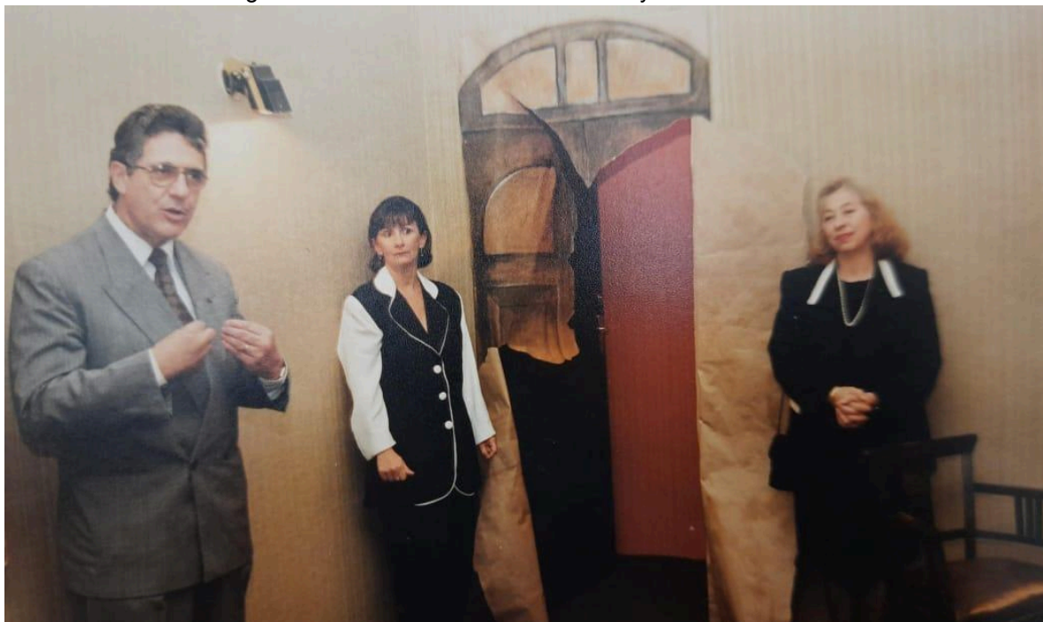
Figura 6 - Cenário montado na sala Polytheama em 1996