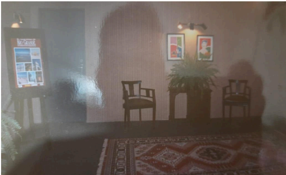
Figura 12 - Foyer do teatro em 1996